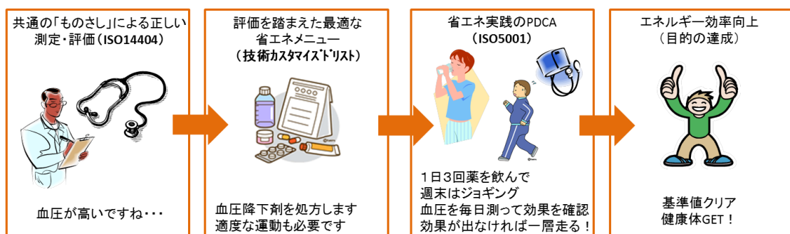
図1 三本柱における各柱の位置づけ

なお、認証取得に当たっては、企業と最も異なる点として、団体としての取り組みに置ける責任の明確化や、ガバナンスをどうに捉えるかという苦労も経験し、度自主的な取り組みの意義を今一度見つめ直す好機ともなったと考えている。今後とも自主的な取り組みにおけるエネルギー管理レベルの向上を鉄連全体として図ることによって、自主的取り組みの信頼性向上に些かなりとも貢献していく決意である。と同時に、3 本柱の一つとして、途上国におけるエネルギー管理システムの一つのモデルとして普及・展開することも併せて考えて行きたい。